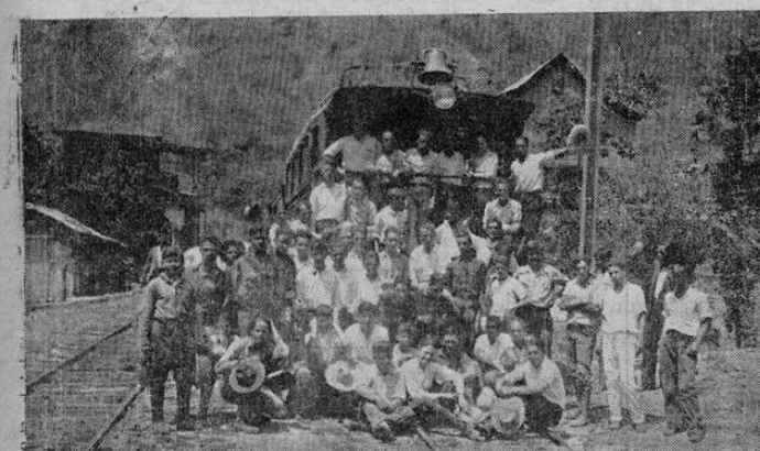
Alegre grupo de excursionistas a Pigres, según nuestra crónica de ayer

Se aumenta el gravamen de importación de la harina, tabaco extranjero, gasolina, joyería de fantasía etc.